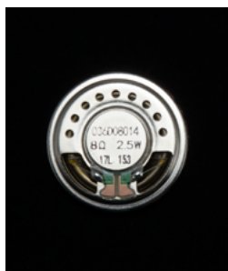
Icoms spezieller Hochleistungs-Lautsprecher