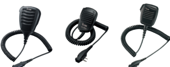
HM-168LWP HM-158LA HM-159LA

HM-159LA: Lautsprecher-Mikrofon mit 3,5-mm-Stecker