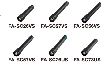
FA-SC57VS FA-SC26US FA-SC73US