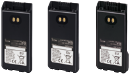
BP-278 BP-279 BP-280

BP-278: 1190 mAh (typ.), 1130 mAh (min.) aufladbarer Li-Ionen-Akkupack BP-279: 1570 mAh (typ.), 1485 mAh (min.) aufladbarer Li-Ionen-Akkupack BP-280: 2400 mAh (typ.), 2280 mAh (min.) aufladbarer Li-Ionen-Akkupack