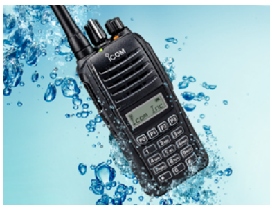
Wasserdicht für 30 Minuten in 1 m Tiefe