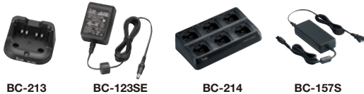
BC-213 BC-123SE BC-214 BC-157S

* Der Ladeadapter AD-130 wird mit dem BC-214 geliefert, je nach Version.