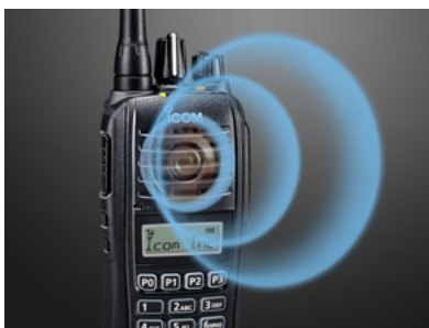
1500 mW NF-Leistung