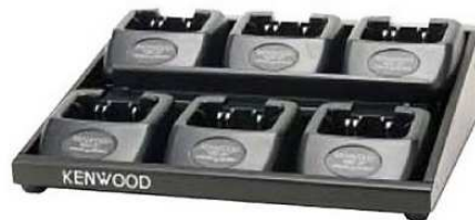
KMB-35 mit Ladeschalen